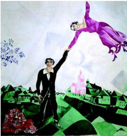
El paseo Chagall

Esto nos hace sentir insatisfechas como personas, porque renunciamos a nuestros propios gustos, para satisfacer a la otra persona.