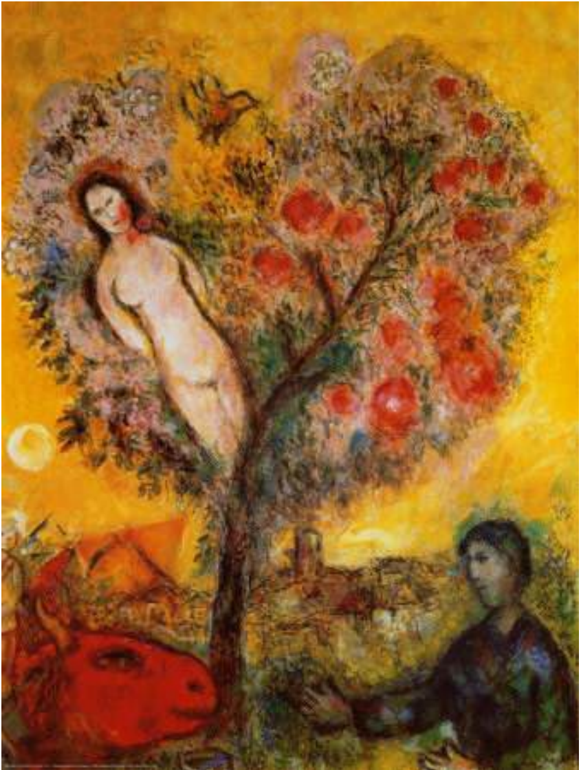
La rama. Chagall