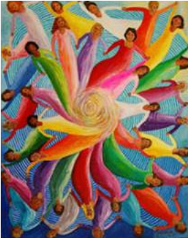
Mujeres en movimiento

Aprender sobre nosotras, sobre lo que queremos en la vida.