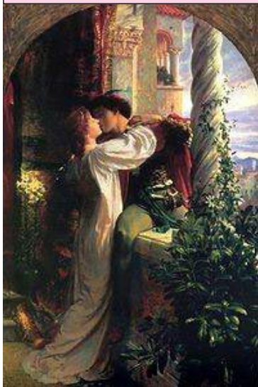
Romeo y Julieta

“Había una vez una princesa linda y dulce y un príncipe fuerte y valiente (...) y fueron felices para siempre”