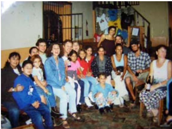
Después de presentación de Sorpresas 2000

Hasta hemos llegado a hacer viajes en conjunto para celebrarnos como grupo, haciendo rituales, paseos nocturnos, analizando nuestra experiencia para esta sistematización y sacando lo de adentro para afuera. Son momentos de compartir, que nos dan fuerza y nos hacen abrir el corazón.