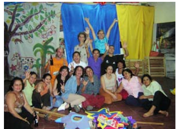
Cierre de año 2004