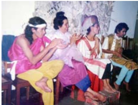
Taller nocturno de Bufón 1997

A partir de 1992 el grupo de teatro "Nuestra Cara" del Colectivo de Mujeres de Matagalpa realiza dos talleres de una semana para mujeres.