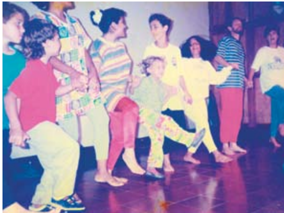
Presentación taller, 1996 bailando con el público y con telas