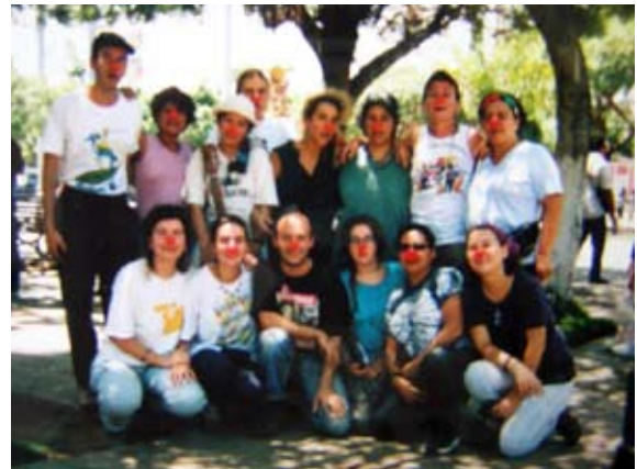
Paseo en el Mombacho 2001