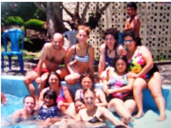
Paseo en Estelí 2003